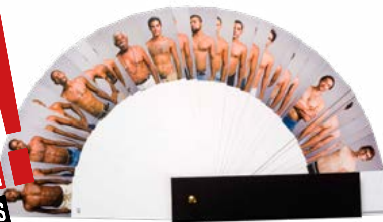
Nuancier : © Pierre DAVID.

ÉGALITÉ, FRATERNITÉ, AGISSEZ LES TEMPS FORTS