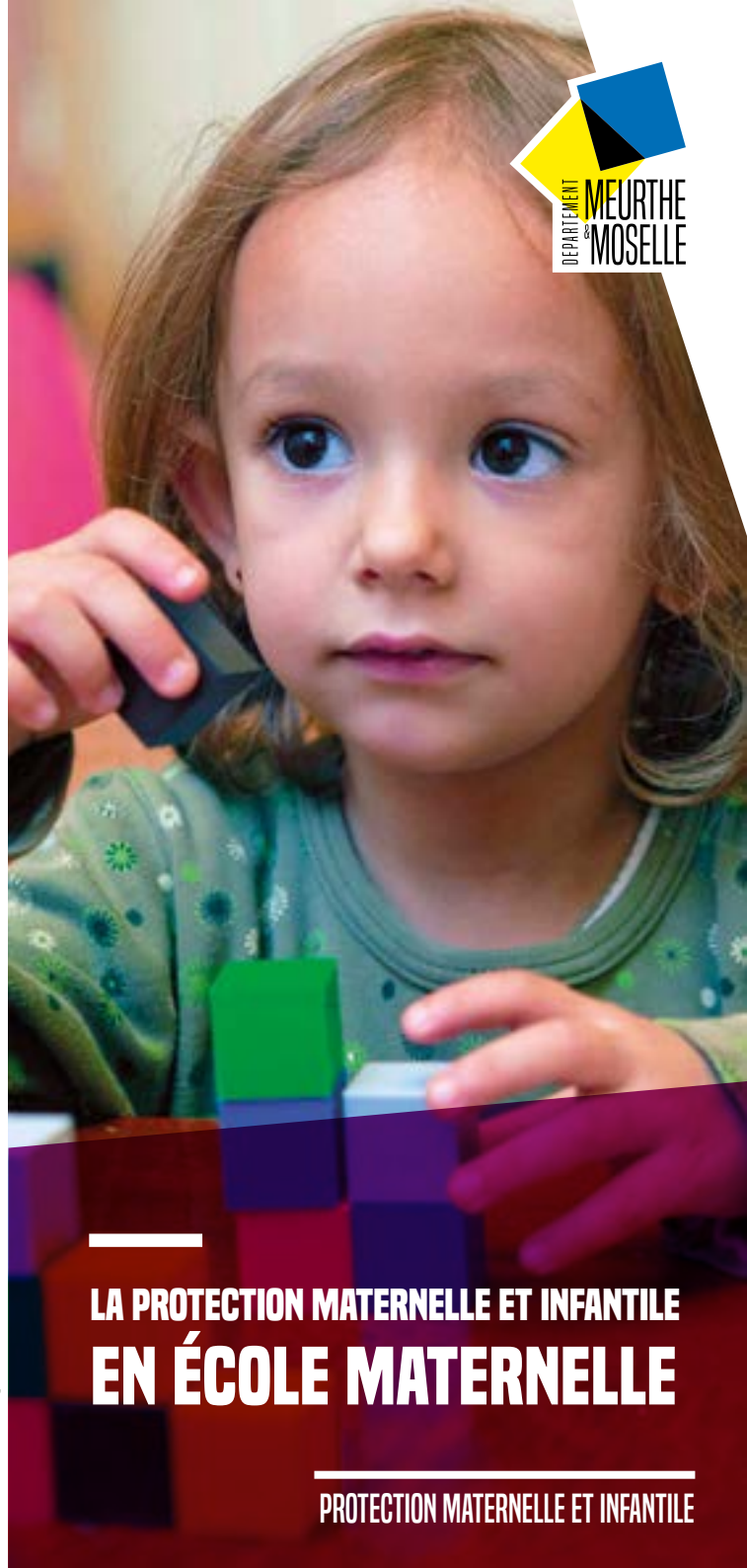
IMPRIM'VERT* PAO DIRCOM CD54 - M. Gourbillon - Imprimerie conseil départemental 54 - Juin 2018

Conseil départemental de Meurthe-et-Moselle