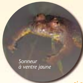
Sonneur à ventre jaune

Le Sonneur à ventre jaune ( Bombina variegata ) tire son nom d'un chant particulier, dont la production en chœur rappelle le son lointain des cloches. Aussi minuscule que toxique, ce batracien dispose d'une botte secrète. En cas d'agression, il arbore ses couleurs - qu'il a vives en face ventrale - et libère un liquide visqueux à l'odeur si repoussante que le prédateur ne l'oublie pas... La fois suivante, il lui suffit de bomber le torse pour tenir l'affamé en respect.