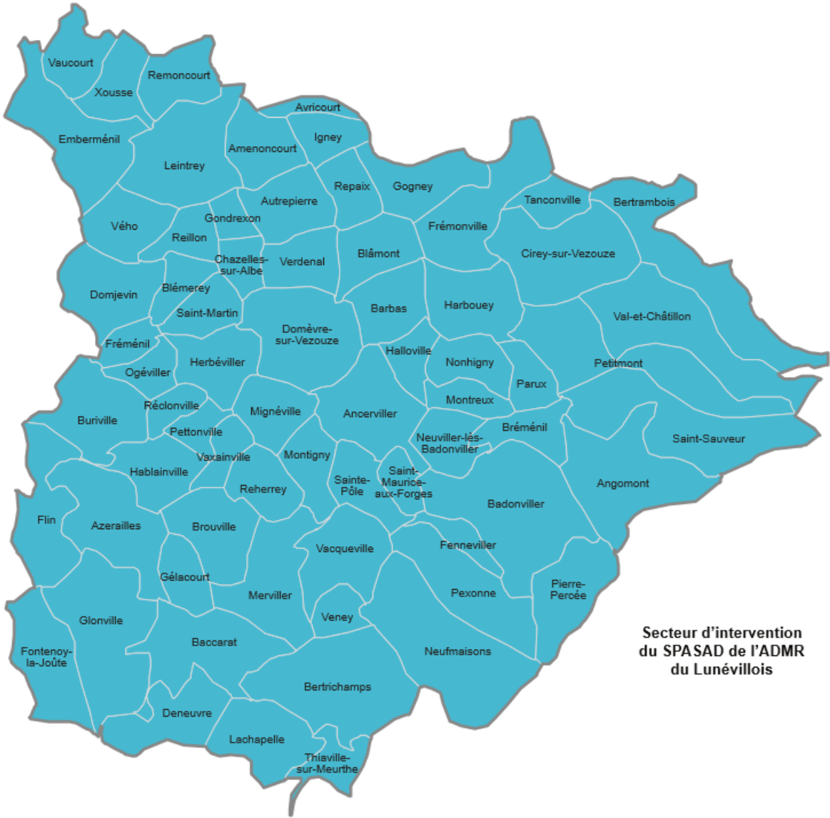
Secteur d'intervention du SPASAD de l'ADMR du Lunévillois