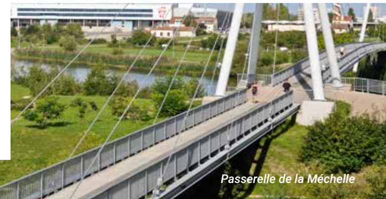
Passerelle de la Méchelle