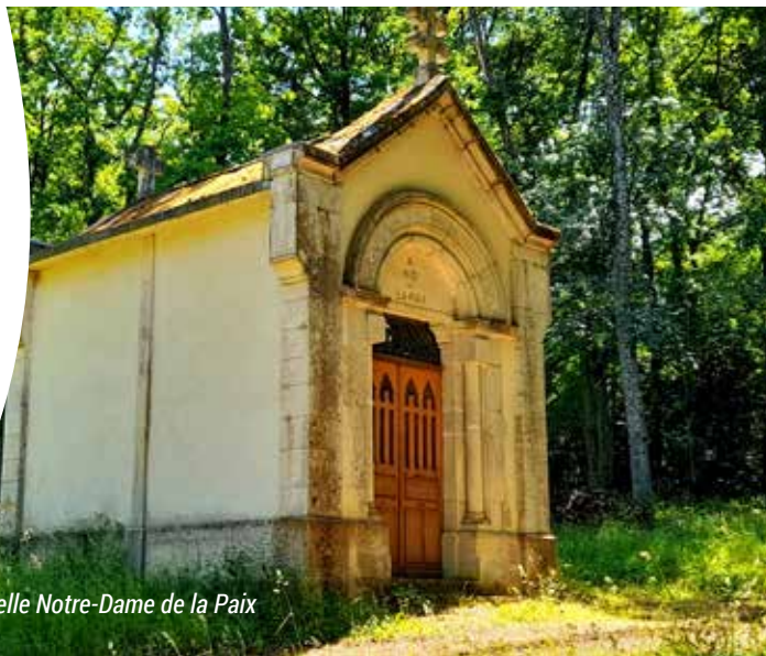
Chapelle Notre-Dame de la Paix