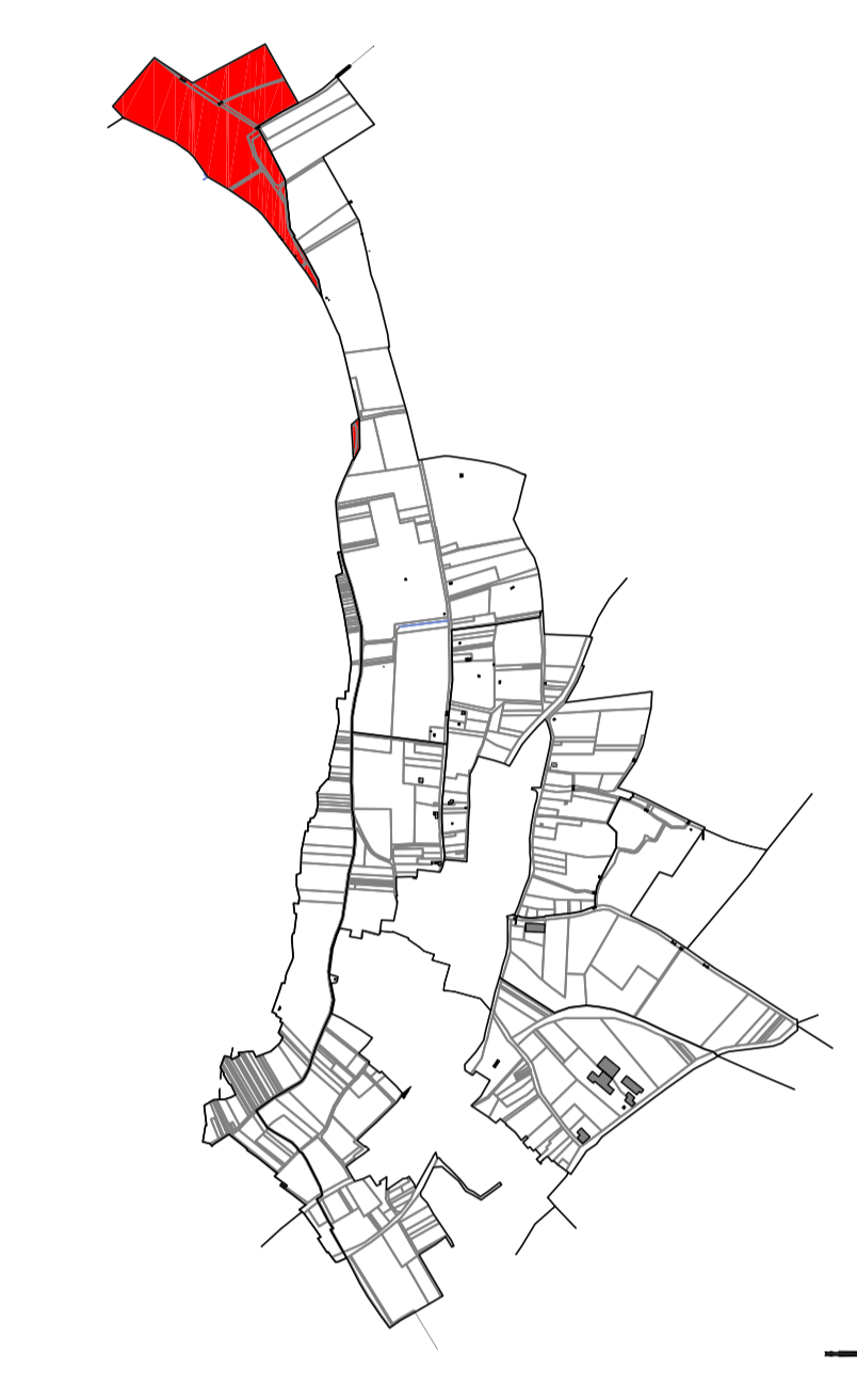
PLANS DE SITUATION SANS ECHELLE